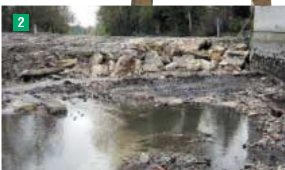
Détournement du cours de l'Essonne : mise en place d'un batardeau