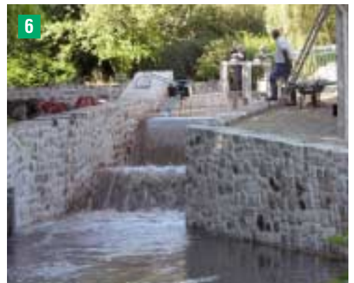
Remplacement de la turbine par un clapet