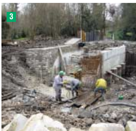
Coffrage du bajoyer

Remplacement du déversoir et de deux vannes par un clapet