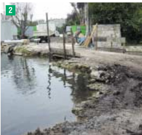
Installation du chantier et mise en place d'un batardeau pour travail à sec

Turbine et passerelle faisant obstacle à l'écoulement des eaux