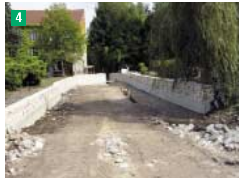
Travail de maçonnerie terminé avant mise en eau (la partie visible est en pierres de taille)