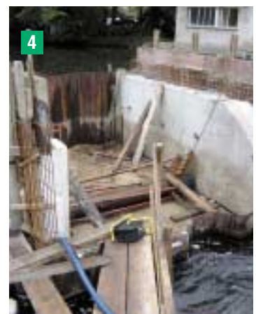
Détail des bajoyers