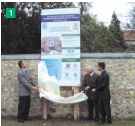
Pose de la première pierre