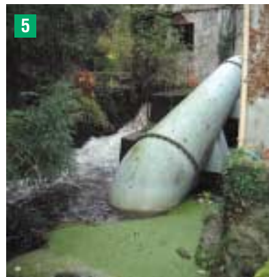
Turbine avant travaux