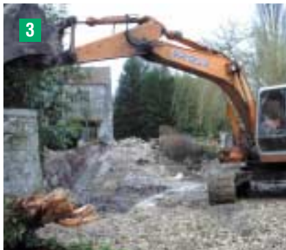
Terrassement des berges pour réhabilitation des murs